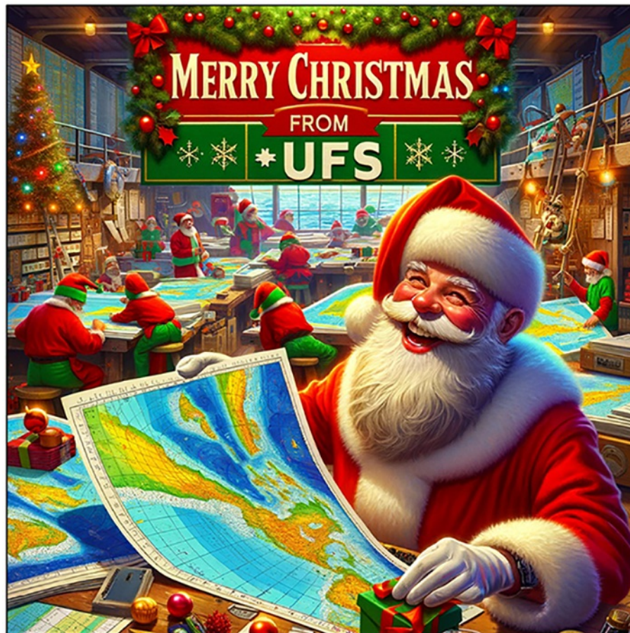
God jul och gott nytt år