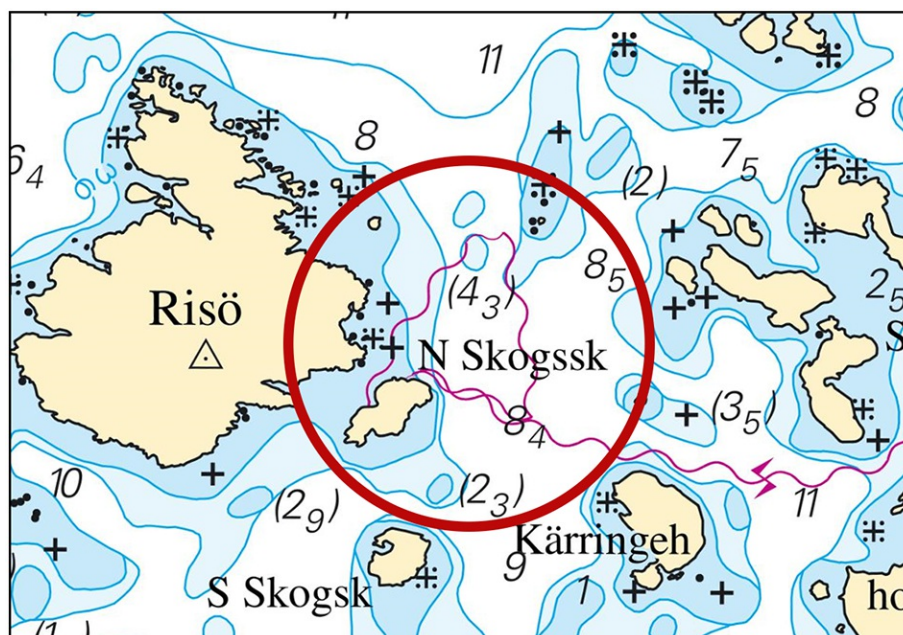
Arbetsområde för dykningar

Bsp Västkusten S 2021/s19, s20, Bsp Västkusten S 2023/s19, s20