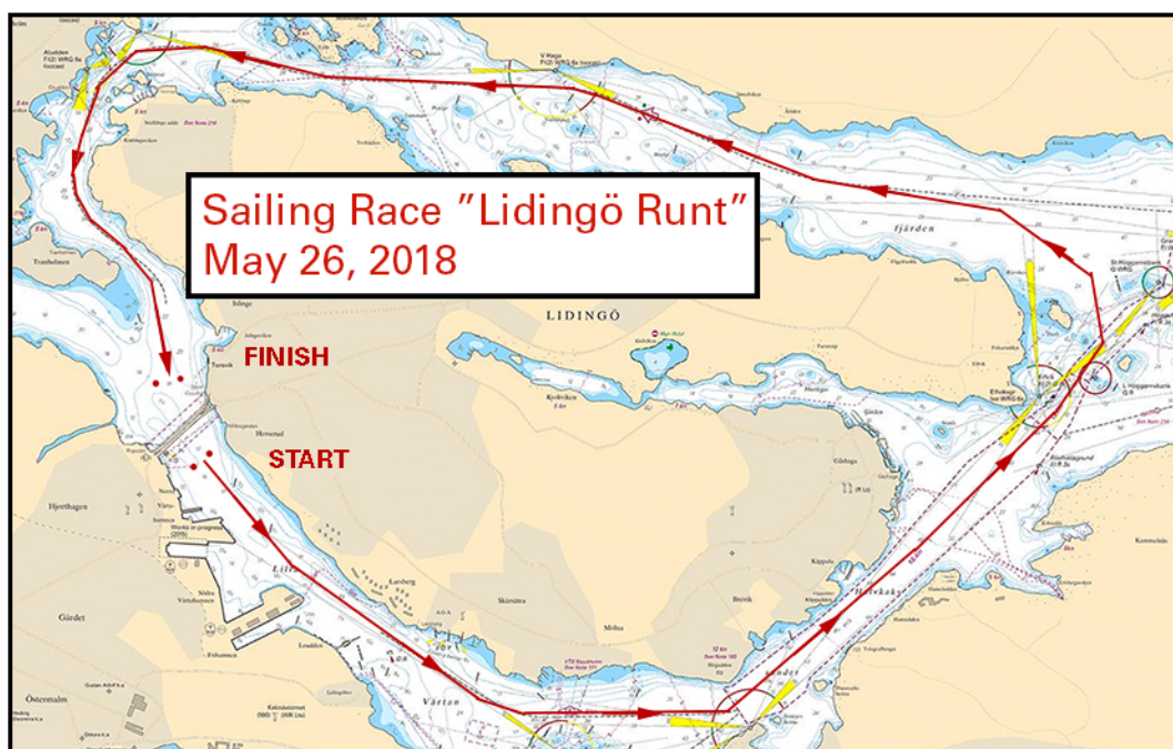
Bansträckning, Lidingö Runt 2018

Bsp Mälaren - Hjälmaran 2016/s53, Bsp Stockholm M 2018/s07, s08, s09, s10, s11, s12, s13, s14, s20, s46